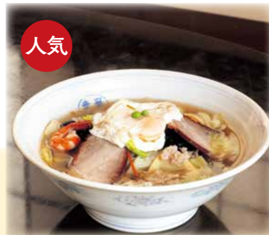
文豪 坂口安吾が愛した 幸華特製 五目そば 1300円