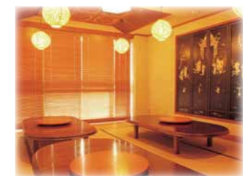
3階 座敷 (要予約)